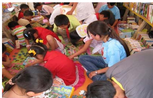
愛心植苗兒童服務站-1:安縣桑棗鎮茶萃鄉

服務站目前已發揮了它的功能，不但為兒童提供了圖書、運動與娛樂的機會，帶來知識、精神與運動的機會，更藉此機會訓練兒童自己動手整理與負責任的生活習慣，也為在身心疲乏的家長舒解了部份壓力。