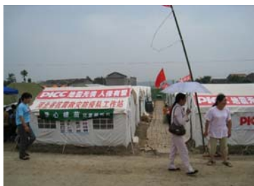
愛心植苗兒童服務站標誌

Grace Chapel, Northeast Chinese Baptist Church Evangelical Formosan Church – Houston