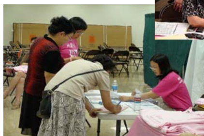
6月21日免費乳房攝影檢查活動剪影