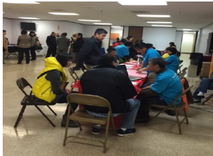
健康日，中華文化服務中心，1/10/2015 光鹽社提供健康保險諮詢