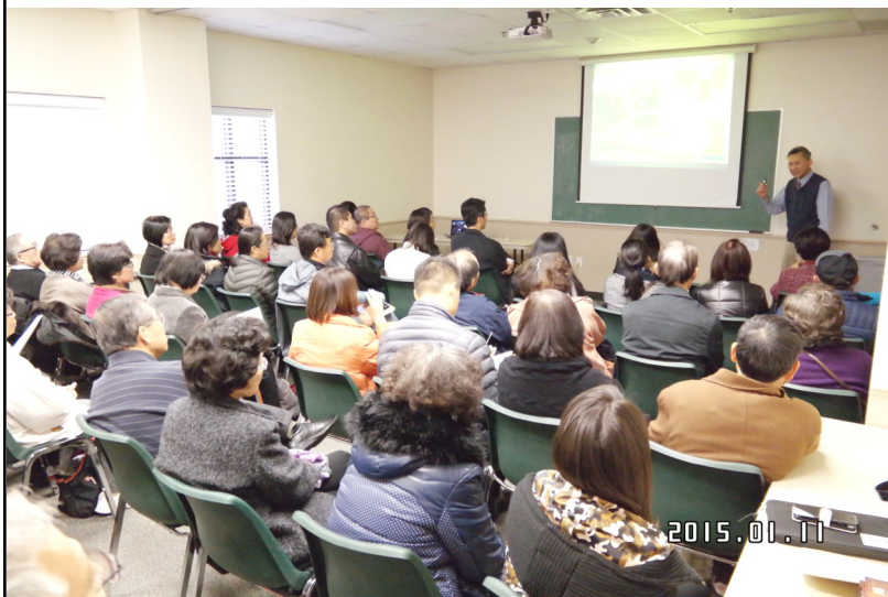
社區服務日，福遍中國教會，1/11/2015