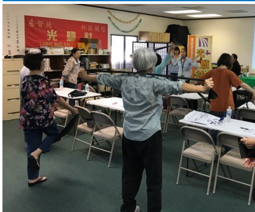
2017年1月14日，MD Anderson醫院講師來光鹽社舉辦“癌症后的健康生活互助小組”，指導參加者使用彈力帶做運動。

我在人生的路上馳騁過、掙扎過、失落過，更是失敗過。但原來上帝沒有讓我白白吃苦，祂在我生命跌宕之時不但尋找我、擁抱我，還給我不再一樣的生命。祂要讓我的人生展開更美的一頁，而且不再是為自己而活，乃是為他而活。雖然前面的挑戰仍多，但深信上帝的恩手會代領我們的隊工，讓我們繼續在這蒙福的服侍中成長。