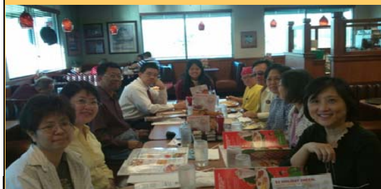
11/12 在 Denny's Restaurant, 輕鬆愉快的氣氛中開同工會