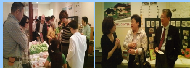
音樂會會場外 SNCC 展示區