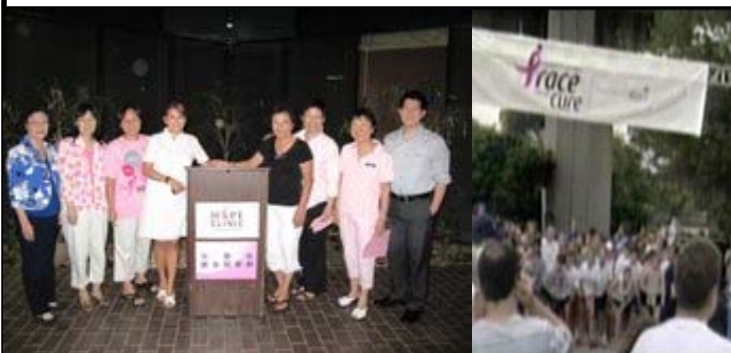
Team Phoenix 競走主辦單位攝于9月1日在Hope Clinic 召開的新聞發布會上

今年光鹽社將與希望診所等其他亞裔社團共同組成競走團隊。我們的隊名 (Team Name)：Team Phoenix。如果您也想參加此競走活動，請與辦公室聯絡室。